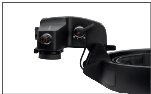
Flip-Up Funktion der Optikeinheit Zur Interaktion mit dem Patienten