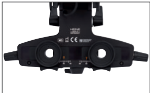
Okulare mit Klickverschluss Um Ihre Sicht zu optimieren, können Sie die montierten Linsen mit +2D gegen die mitgelieferten neutralen Linsen 0D austauschen