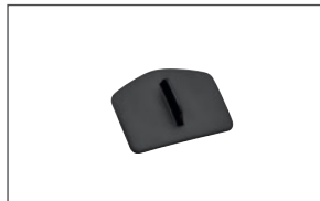
Staubschutzkappe für Frontscheibe